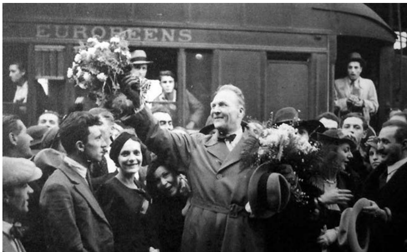
Федор Иванович Шаляпин в эмиграции на гастролях в Софии, 1934 г.

Эмиграция из России до 1917 г. получила условное название «нулевая волна». Хронология трех «волн» русской эмиграции включает: первую, 1917–1940 гг. (пик — 1919–1921 гг. от падения белого движения до 1922 г. — т.н. «Философского парохода»); вторую, 1941–1956 гг. (пик — конец Второй мировой войны) и третью, 1956–1988 гг. (пик — конец 1960-х — 1970-е гг.). С 1989 г. идет отсчет уже новой, четвертой «волны» эмиграции. К ней причисляют и образовавшуюся после августа 1991 г. 25-миллионную русскую диаспору в «ближнем» зарубежье. Сам термин «волна» очень образный — обозначает этапы исхода из России. Мы всегда видим пик волны, но не можем определить точно, где одна волна переходит в другую.