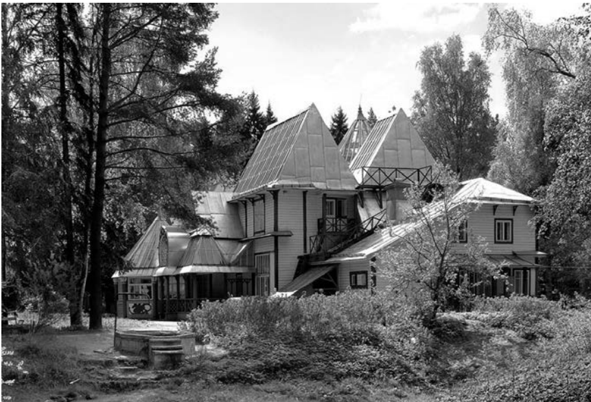
«Пенаты» — музей-усадьба Ильи Ефимовича Репина в поселке Репино (Куоккала) Курортного района Санкт-Петербурга. Современное фото

Значительно меньше эмигрантов из России было в Греции, Бельгии, Италии, Венгрии, Швейцарии. Неожиданно много (по сравнению с коренным населением) русских оказалось в Андорре. Ограничили въезд русских беженцев Испания, Португалия и Великобритания, из колоний которой наши соотечественники проникли только в доминионы — Канаду, Австралию, Южную Африку. Но вместе с тем русские эмигранты появились во всех французских колониях. Единственная независимая африканская страна, христианская Эфиопия, с радостью приютила русских эмигрантов. Активно переселялись выходцы из России в США и страны Латинской Америки (в особенности в Аргентину, Бразилию, Парагвай).