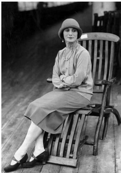
Анна Матвеевна (Павловна) Павлова на борту судна во время австралийского тура, 1929 г.

Гигантским был вклад русской эмиграции в мировое искусство, театр, музыку и кино. Во всем мире известны художники Н. К. Рерих, И. Я. Билибин, А. Н. Бенуа, И. Е. Репин, М. В. Добужинский, М. З. Шагал, В. В. Кандинский; артисты балета А. М. Павлова, Т. П. Карсавина, О. П. Спесивцева, М. Ф. Кшесинская, М. М. Фокин, В. Ф. Нижинский, Н. Г. Легат; певцы и артисты Ф. И. Шаляпин, А. Н. Вертинский, Юл Бриннер; композиторы С. В. Рахманинов, И. Ф. Стравинский, С. С. Прокофьев и др. Русскую художественную школу за рубежом прославил скульптор Г. В. Дерюжинский.