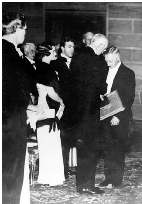
Шведский король вручает Ивану Алексеевичу Бунину Нобелевский диплом. Стокгольм, 1933 г.

Эмигранты первой «волны» создали внетерриториальную страну — «Русское Зарубежье» («Зарубежную Россию», «Россию № 2», «Россию вне России» и т.д.), обладавшую всеми признаками государственности. Элита русской эмиграции была прямой наследницей «Золотого» и «Серебряного» веков русской культуры, а себя рассматривала как единственную законную правопреемницу национальных традиций. В местах компактного проживания русские создали «Зарубежную Россию» как страну без территории, но со всеми внешними и внутренними признаками и атрибутами (правительство, Церковь, РОВС в качестве армии и даже претенденты на царский трон), — культурную жизнь как целостную систему (школы, университеты, библиотеки, музеи, архивы, периодическая печать, книгоиздательства, общественные объединения, кружки и т.п.). Русские становятся как бы государством в государстве, а их культура — особой культурой в рамках существующей национальной культуры того или иного государства. Возникает идея особой духовной миссии: сохранения и приумножения русской культуры, разрушаемой, по мнению эмиграции, в Советской России 4 . Отсюда и знаменитое