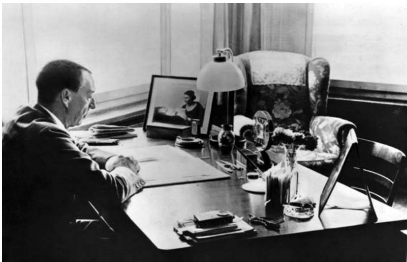
Сергей Васильевич Рахманинов за работой в своем кабинете в имени «Сенар» (Швейцария), 1930-е гг.

Особую категорию составляют русские — уроженцы стран-лимитрофов, — государств, образованных на западе Российской империи (Финляндии, Эстонии, Латвии, Литвы, Польши, Румынии) Западом для «санитарного кордона» от большевизма для Европы. В этих странах проживало аборигенное (коренное) русское население. Никуда не уезжая, местные русские оказались в эмиграции, хотя в этих странах жили и «классические» эмигранты — беженцы из России. В Финляндии, кроме русских горожан в Выборге (Виипури) и Гельсингфорсе (Хельсинки) и крестьян в Райволе (ныне Рождино) и Красном Селе, было много «дачников» — обитателей загородных домов под Петроградом в поселках Оллила (Солнечное), Куоккала (Репино), Келломяки (Комарово), Териоки (Зеленогорск), Тюрисевя (Ушково) и т. д.