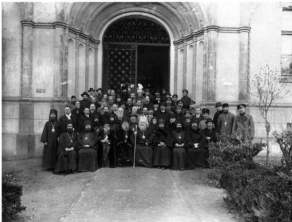
Участники Первого Карловацкого Собора — собрания русского зарубежного духовенства и мирян в Сремских Карловцах (Сербия), 1921 г.

Русское Зарубежье как самостоятельное культурное и политическое явление сложилось к началу 1920-х гг. Основными странами расселения первой «волны» русской эмиграции стали Германия (до начала 1930-х гг.) и Франция. Наиболее благоприятными для русской эмиграции были славянские страны — Королевство Сербов, Хорватов и Словенцев (Югославия), Болгария, Чехословакия. «Столицами» Русского Зарубежья стали Берлин (с конца 1919 г. до середины 1930-х гг.) и Париж, а на Дальнем Востоке — Харбин и Шанхай (с 1930-х гг.). Уже про Берлин стали рассказывать такую шутку: «Встречаются два русских эмигранта, видевшиеся последний раз на Родине, и один другого спрашивает: „Как тебе Берлин?“ — „Да ничего город, — отвечает другой, — только немцев почему-то очень много“». Потом этот анекдот стали рассказывать о Париже и Нью-Йорке. Другими центрами были Прага, Белград и София.