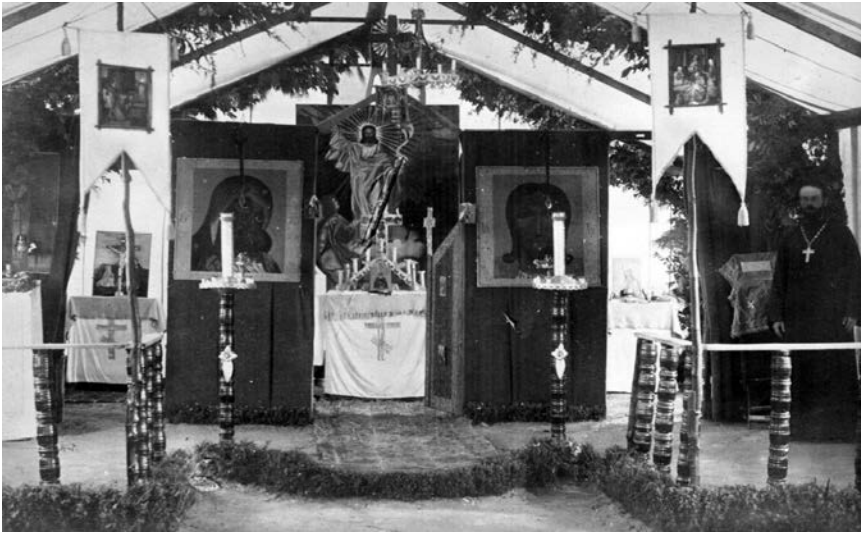
Церковь эвакуированного из Крыма в 1920 г. Корниловского полка в Галлиполи (Греция), 1921 г.

Значительно меньше эмигрантов из России было в Греции, Бельгии, Италии, Венгрии, Швейцарии. Неожиданно много (по сравнению с коренным населением) русских оказалось в Андорре. Ограничили въезд русских беженцев Испания, Португалия и Великобритания, из колоний которой наши соотечественники проникли только в доминионы — Канаду, Австралию, Южную Африку. Но вместе с тем русские эмигранты появились во всех французских колониях. Единственная независимая африканская страна, христианская Эфиопия, с радостью приютила русских эмигрантов. Активно переселялись выходцы из России в США и страны Латинской Америки (в особенности в Аргентину, Бразилию, Парагвай).