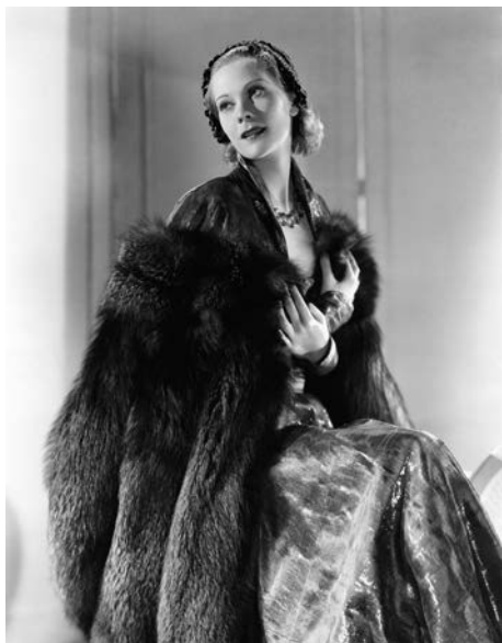
Княжна Наталья Павловна Палей (Натали Палей) — известная французская манекенщица и актриса, внучка императора Александра II

империи, а особенности Гражданской войны заключались в том, что белые не смогли занять как раз центральные регионы Европейской России. Вынуждены были эмигрировать или даже насильно выслались те, кто составлял гордость российской культуры и науки, можно даже сказать — «цвет нации».