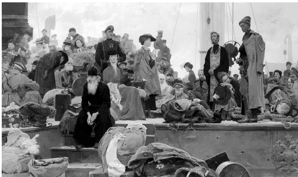
Белая Россия. Исход. Худ. Д. А. Белюкин, 1992–1994 гг.

После революции 1917 г. русская культура разделилась на две ветви. В результате победы большевиков в Гражданской войне в СССР стала главенствовать коммунистическая идеократия, и развитие «независимой» отечественной мысли и культуры происходило или подпольно в СССР, или в эмиграции. Русская эмиграция стала, образно выражаясь, полигоном «свободной мысли», а книги и периодика — это материализация мысли. В XX в. русские люди оказались за рубежом без средств к существованию, потеряли все, включая и любимую Родину, но при этом представители первой «волны» были искренними патриотами. Поэтому основное настроение — ностальгия, а основная тема — воспоминания о Родине — России, «как было хорошо в России до большевиков». Ностальгия способствовала массовому творчеству, особенно, автобиографическим романам и мемуарам. На долю этого поколения пришлось очень бурная жизнь начала XX в. — русско-японская война, «стольпинские реформы», Первая мировая и Гражданская войны, эмиграция и т. д. В такую беспокойную эпоху биография каждого человека, даже самого «простого», была как увлекательный роман. Учитывая высокий уровень образования «первой» волны, все вышперечисленное способствовало развитию литературной, публицистической и издательской деятельности.